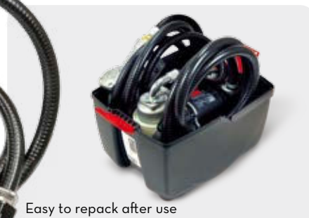
Easy to repack after use