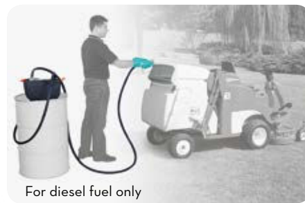
For diesel fuel only