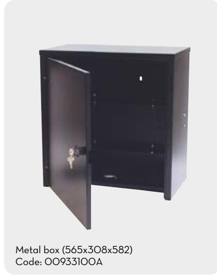
Metal box (565x308x582) Code: 00933100A