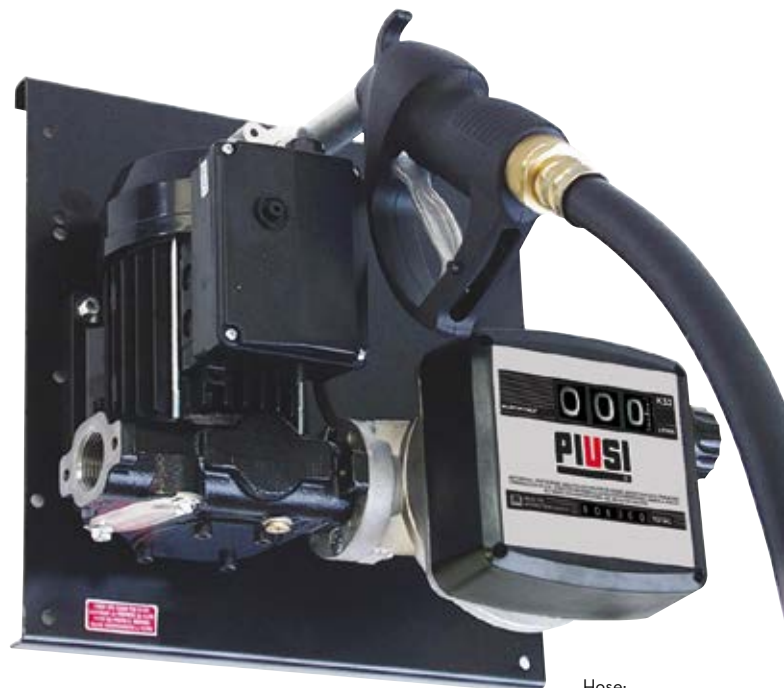
Hose: - length 4 m - Ø 1"