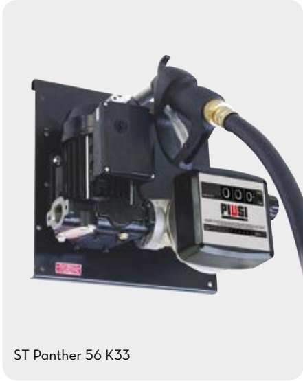
ST Panther 56 K33