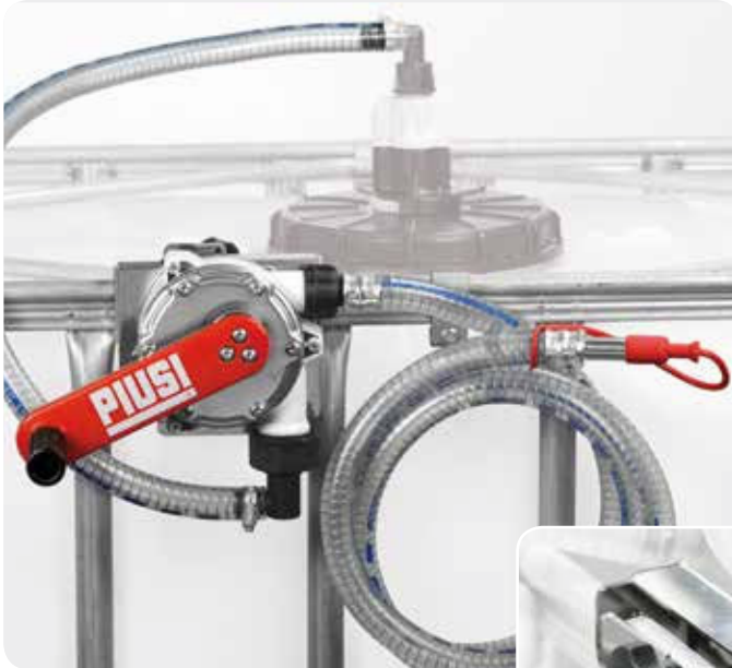
Without filter version