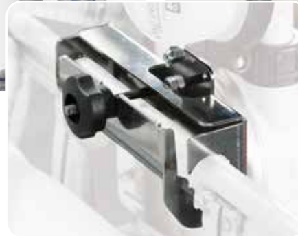
Steel support IBC brachet