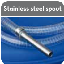
Stainless steel spout

Code F20189000 56x4 buttress 1" BSP Code F20190000 2" buttress 1" BSP Code F20257000 2" BSP 1" BSP Code F20258000 2" 70x6 1" BSP (with drum adapter)