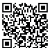
PIUSI HAND PUMP VIDEO