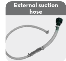
External suction hose

Code F00611D10 (Only for version with filter)