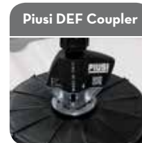
Piusi DEF Coupler