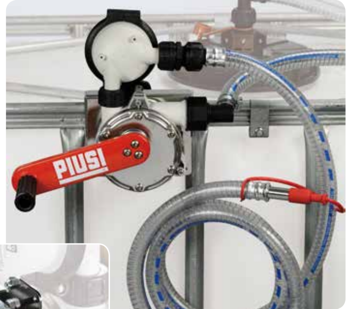
With filter version