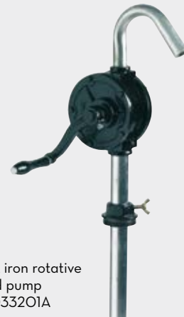
Cast iron rotative hand pump FOO33201A