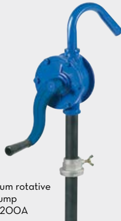
Aluminium rotative hand pump FOO33200A