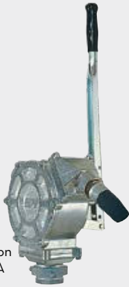
PM GPI Piston FOO31600A