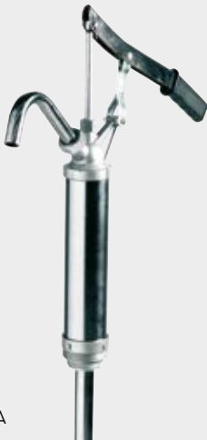
Piston hand pump 25 l/m' FOO34900A