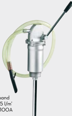
Piston hand pump 35 l/m' FOO35100A