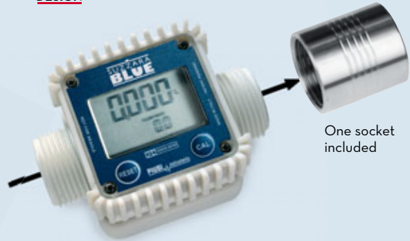
One socket included