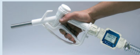
Manual nozzle with K24