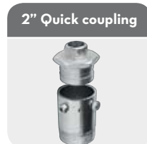
2" Quick coupling