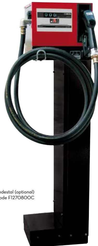
Pedestal (optional) Code F1270800C