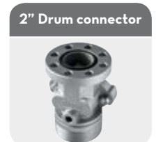
2" Drum connector