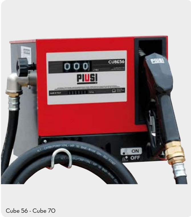
Cube 56 - Cube 70