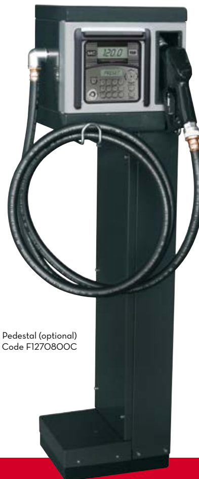
Pedestal (optional) Code F1270800C