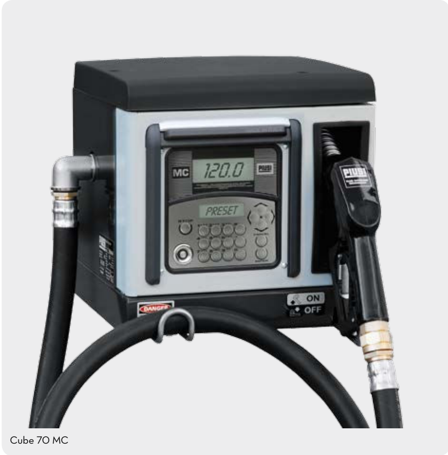
Cube 70 MC